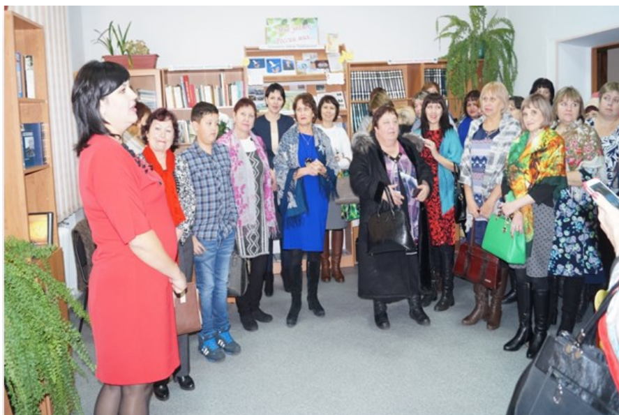
Экскурсия для коллег по обновленной библиотеке, 2016 г.