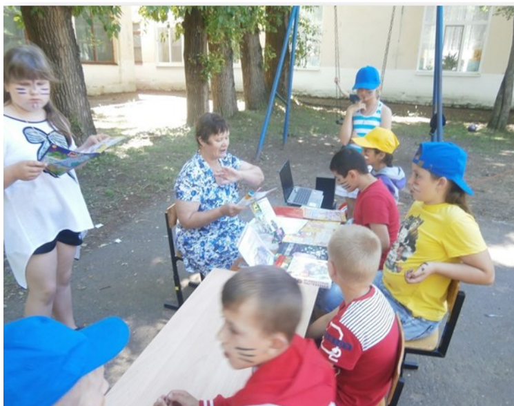
Читальный зал под открытым небом, 2018 г.