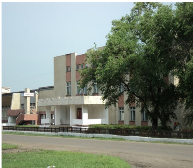
Дом культуры с. Козьмодемьяновка, 2018 г.

В 1973 году началось строительство нового Дома культуры, который открыл свои двери для посетителей в 1975 году. На втором этаже было выделено помещение, в котором расположилась библиотека с фондом 10 тысяч экземпляров книг. Для читателей поставили столики с периодическими изданиями, новинками литературы.