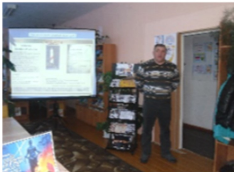
Проект памяти деда