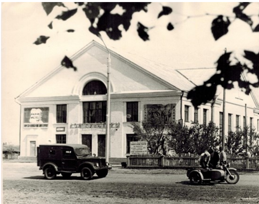
Здание Дома культуры с.Козьмодемьяновка, 1962 г.

В 1962 году состоялось открытие нового здания Дома культуры. Для библиотеки было выделено просторное помещение, которое состояло из трех больших комнат. Появилась возможность и фонд расставить свободнее, и в читальном зале периодику выделить. Периодических изданий библиотека получала много, читательские запросы практически удовлетворялись полностью.