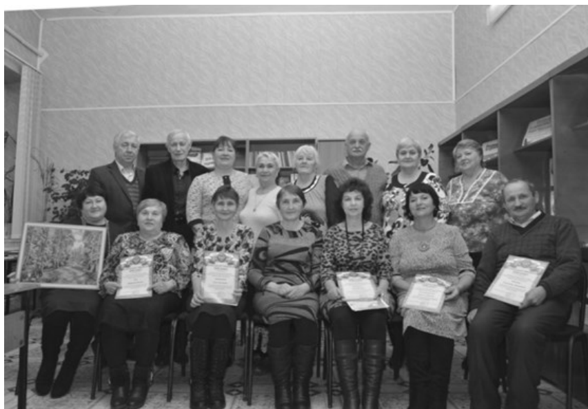
Участники клуба «Вдохновение»

Пусть полиграфический уровень изданий не высок, но они есть и останутся для новых поколений читателей. Ведь это не просто стихи и рассказы. В них – история своей малой Родины. И сегодняшняя действительность, отражённая в стихах и прозе местных авторов, завтра может стать историческим фактом.