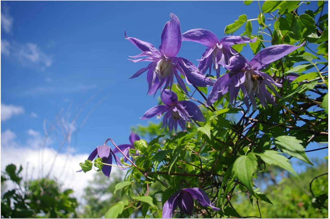
Цветение княжика крупнолепесткового в Зейском заповеднике