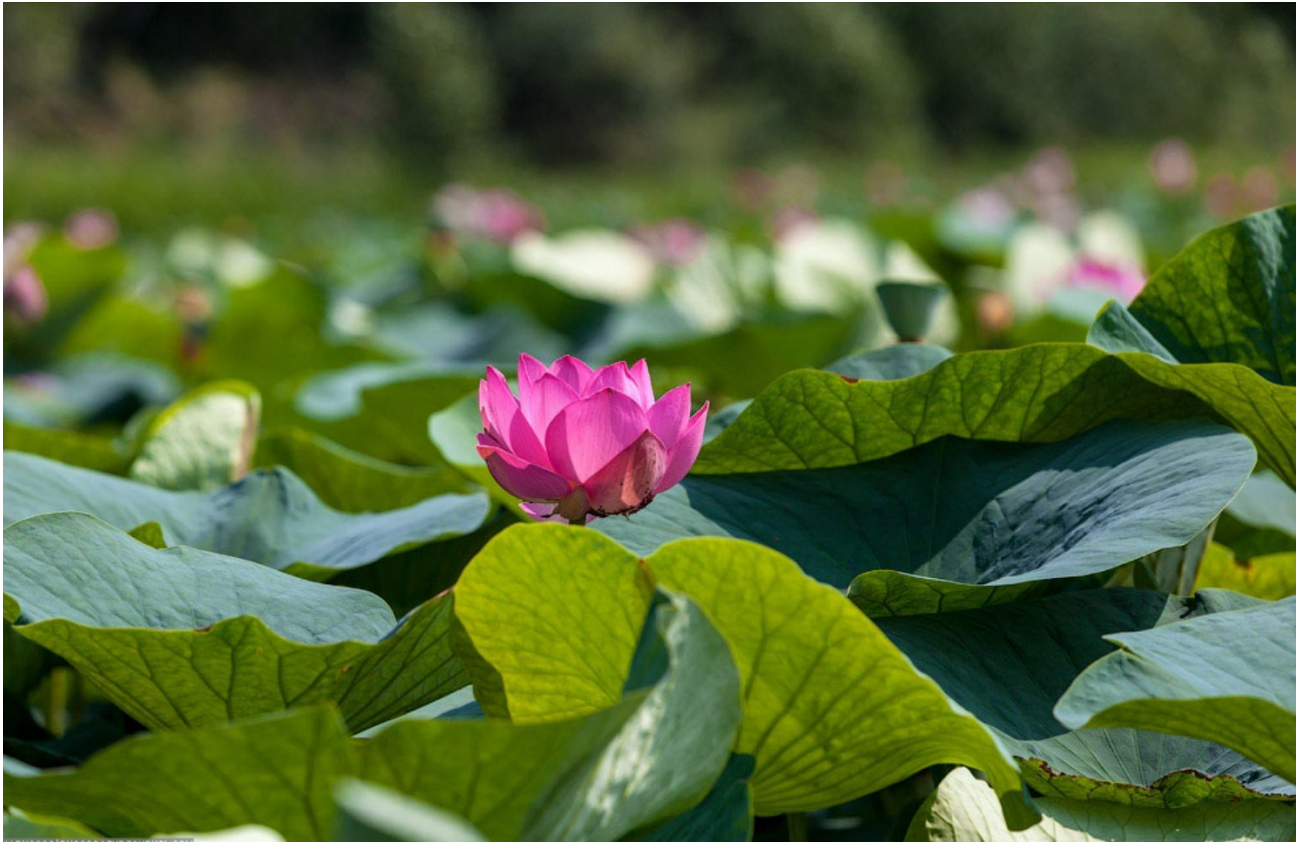
Лотос – жемчужина Хингана