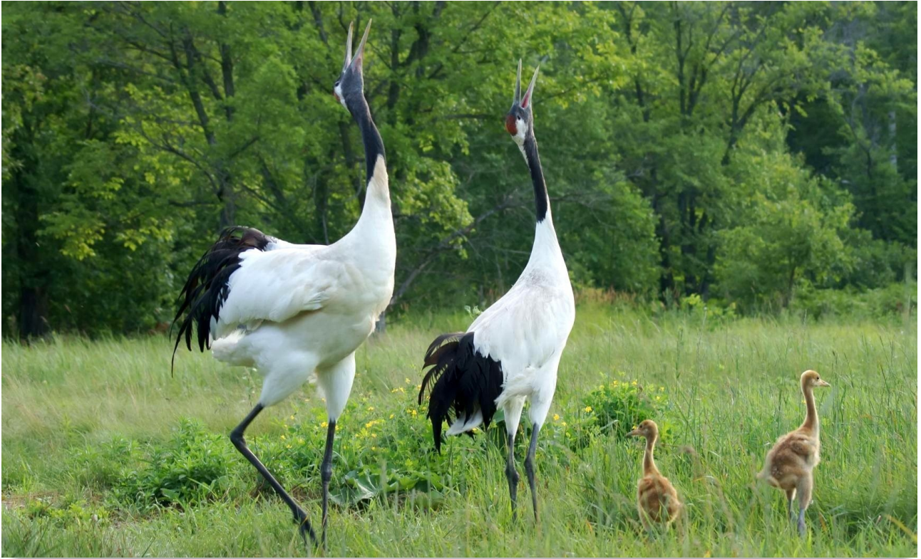
Журавли в Хинганском заповеднике