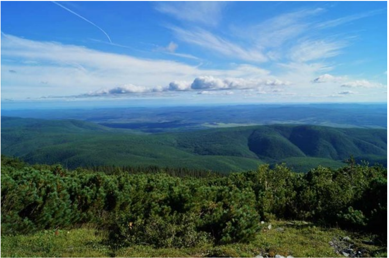
Виды Зейского заповедника