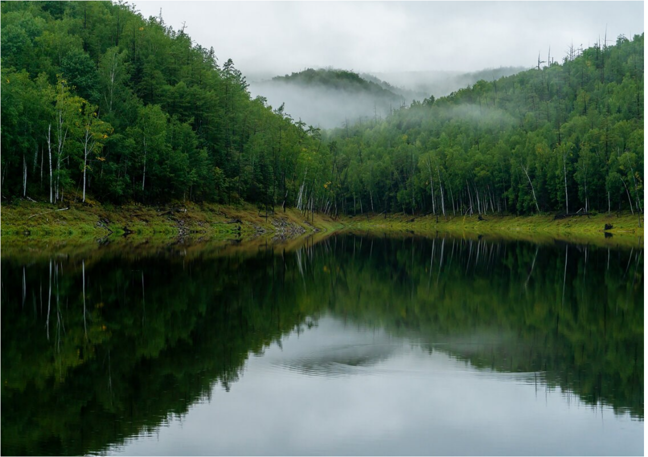
Природа Зеи заповедная