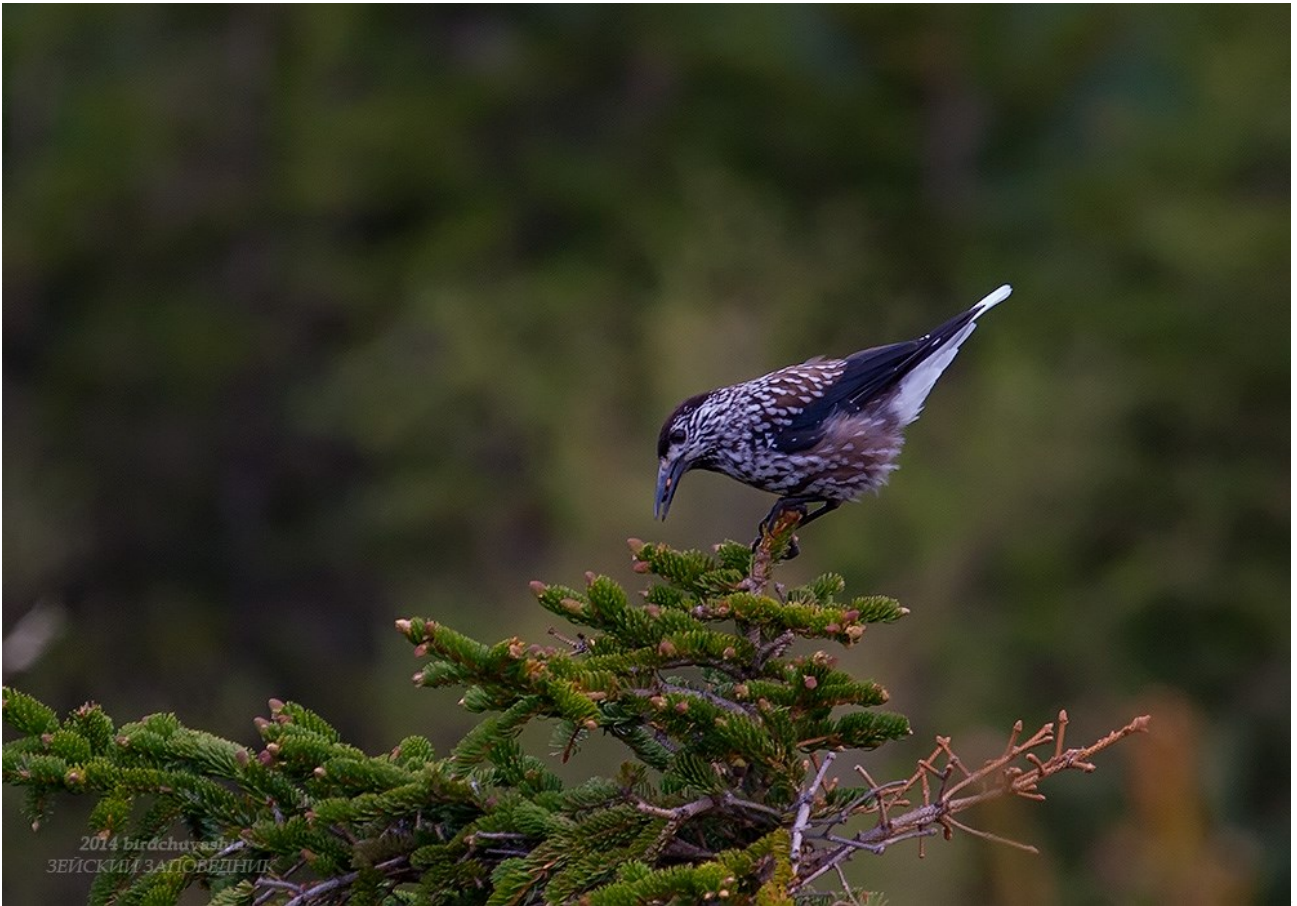
Птицы Зейского заповедника