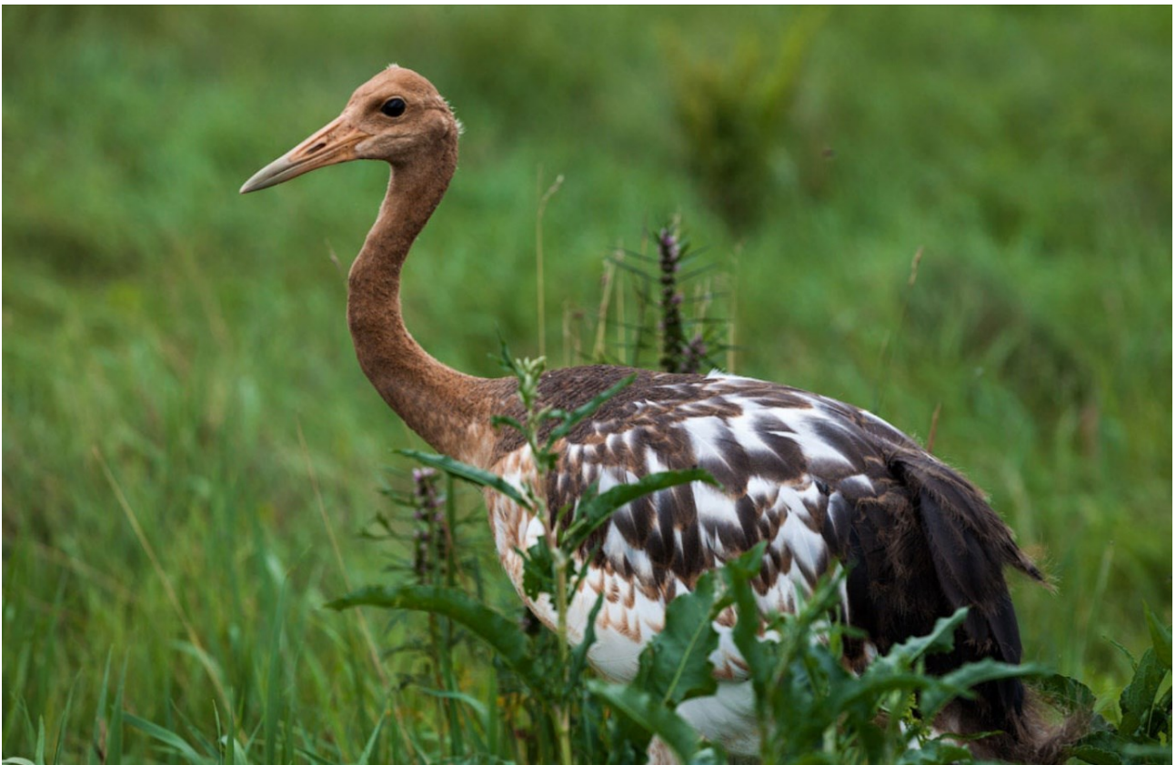
Птенец журавля в Хинганском заповеднике