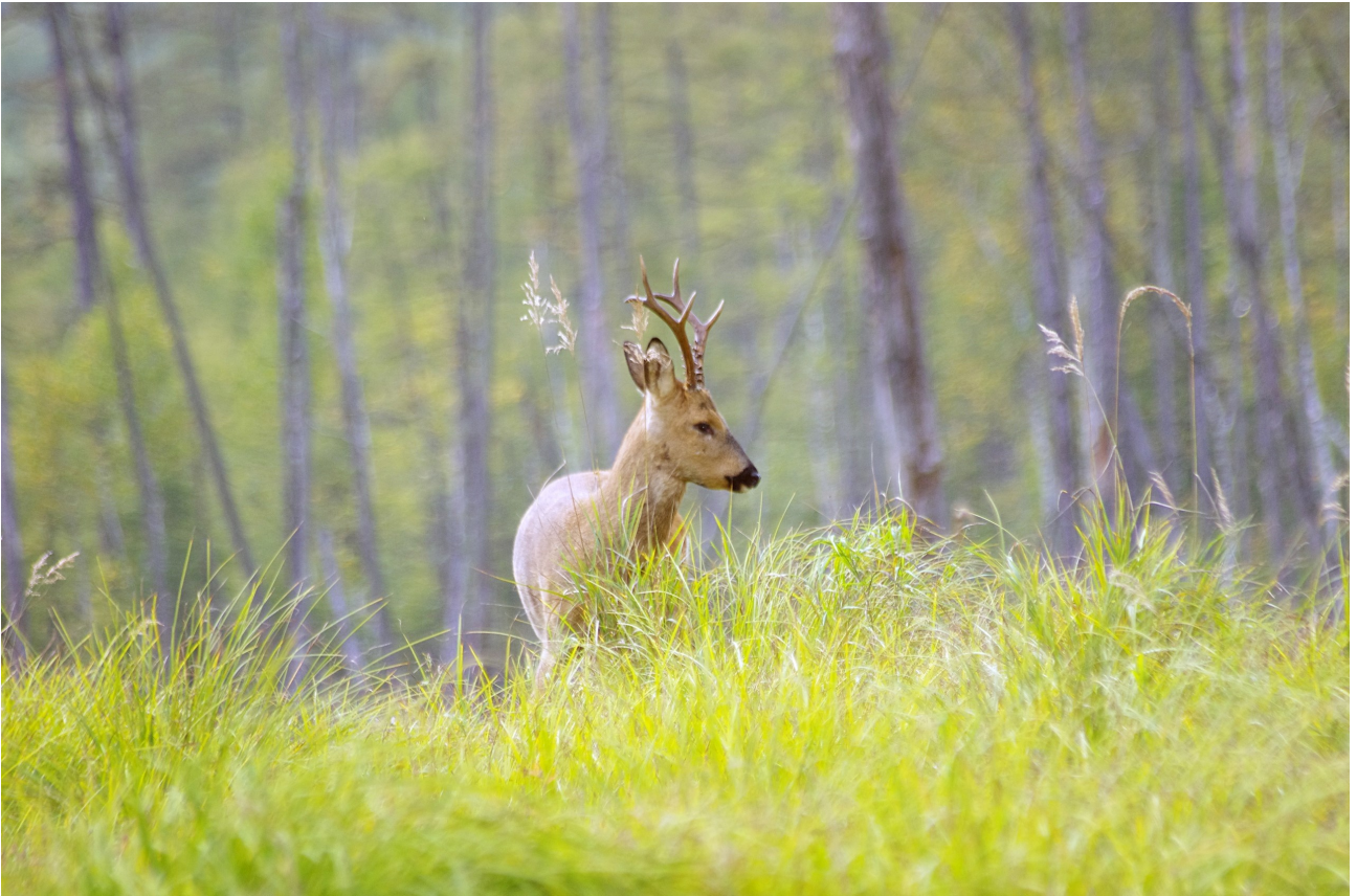
Один из обитателей Зейского заповедника