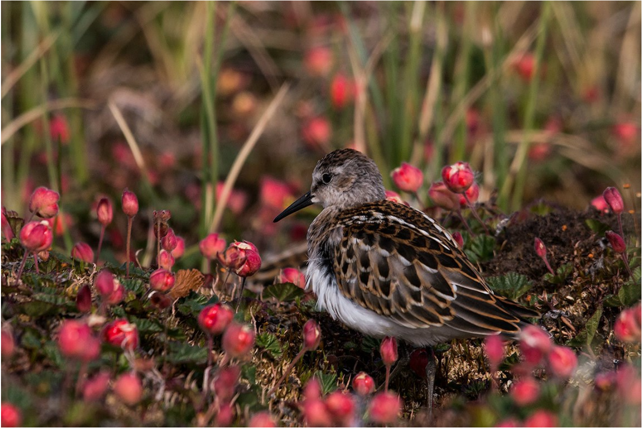
Пернатая обитательница Хинганского заповедника